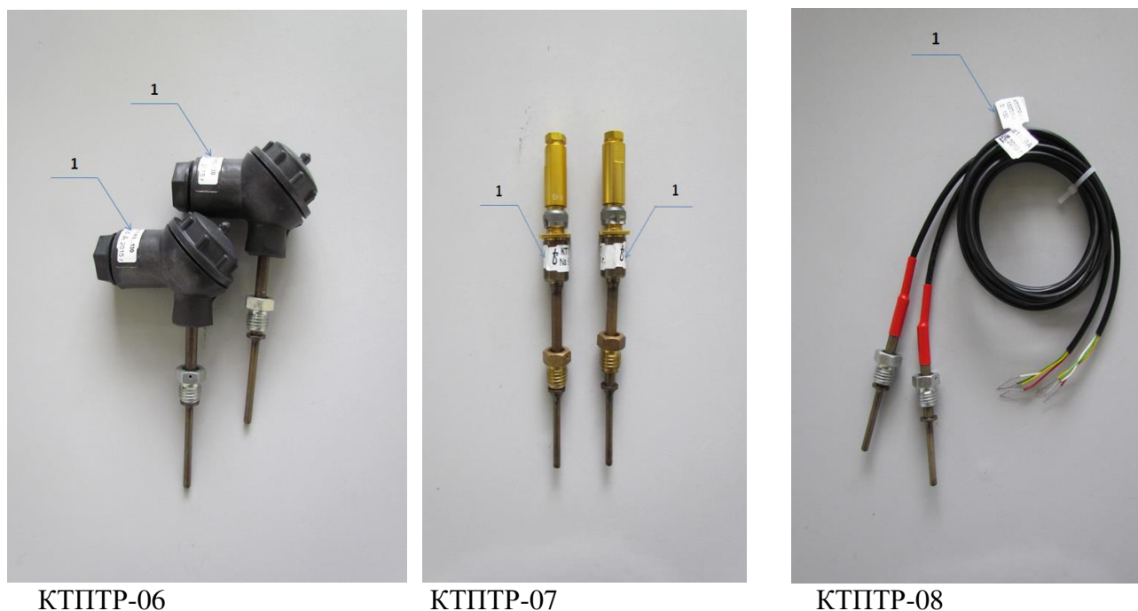
Рисунок 2 – Внешний вид комплектов термометров платиновых технических разностных КТПТР-06, КТПТР-07, КТПТР-08 (1 – место нанесения заводского номера)

Подключение термометров к измерительным устройствам осуществляется по четырехпроводной схеме.